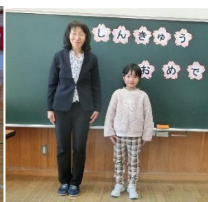
先生と一緒にの2年生！