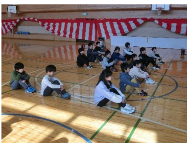
始業式、しっかりと聞いていますよ！